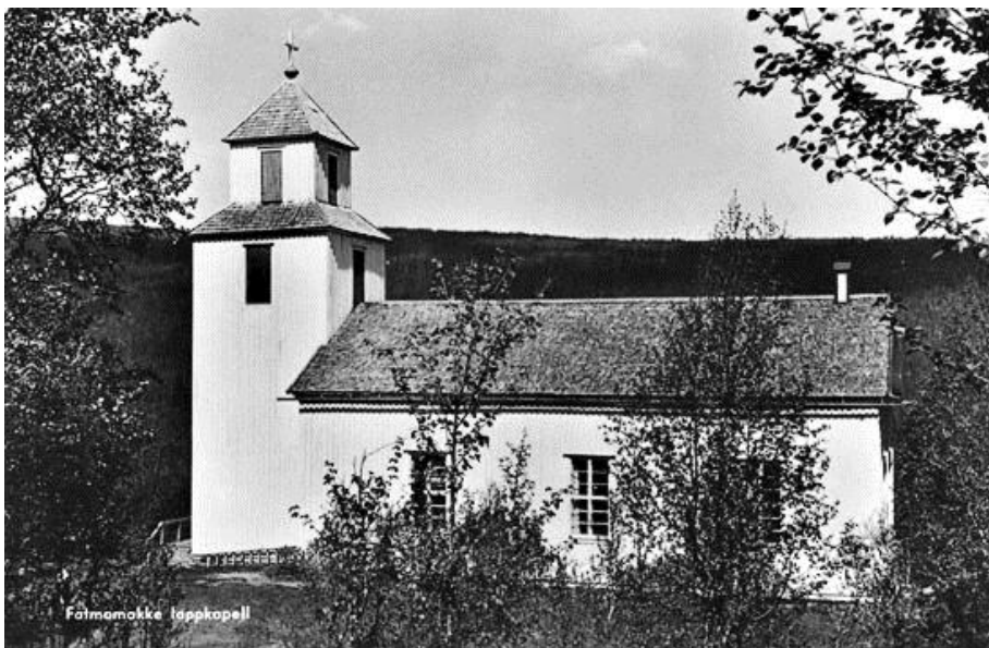
Fatmomakke kyrka.

Elias (1), som senare kom att ”kvacka” som byskomakare vid sidan om bondearbetet – med tveksamt resultat, fick hjälp av sin bror med att bygga Strömnäsgården och de tycks där ha visat så goda anlag att de senare ombads att delta i byggnationen av Fatmomakke kyrka 1833. Troligtvis byggdes huset för födorådstagarna och Strömnäsgården samtidigt. Förmånsstugan kom senare att kallas ”Katt-Lisas stuga” efter Elias (1) sondotter.