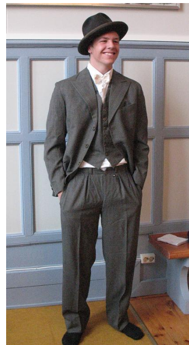
Provning av gamla kläder i Vilhelmina tingshus.